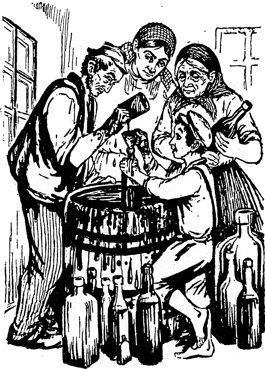
די ארבעס אין געווען איינעטיילט מיט